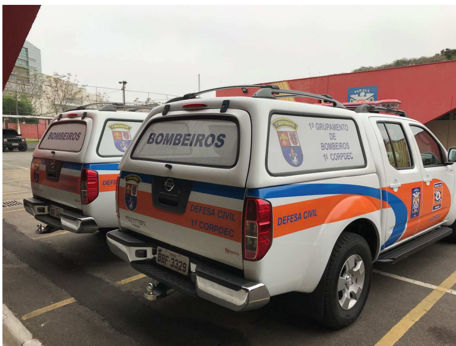
Figura 5 – Caminhonetes distribuídas ao 1º CORPEDEC