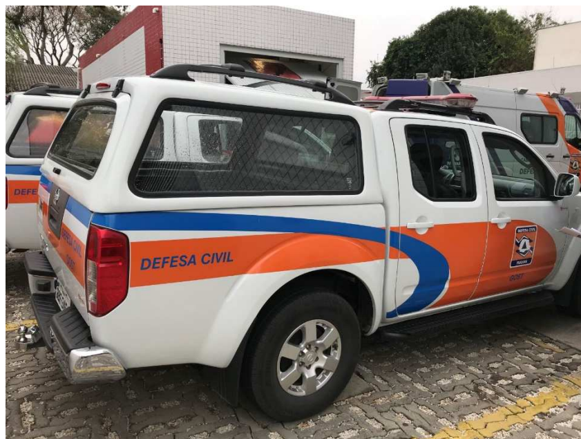
Figura 2 – Caminhonetes distribuídas ao GOST