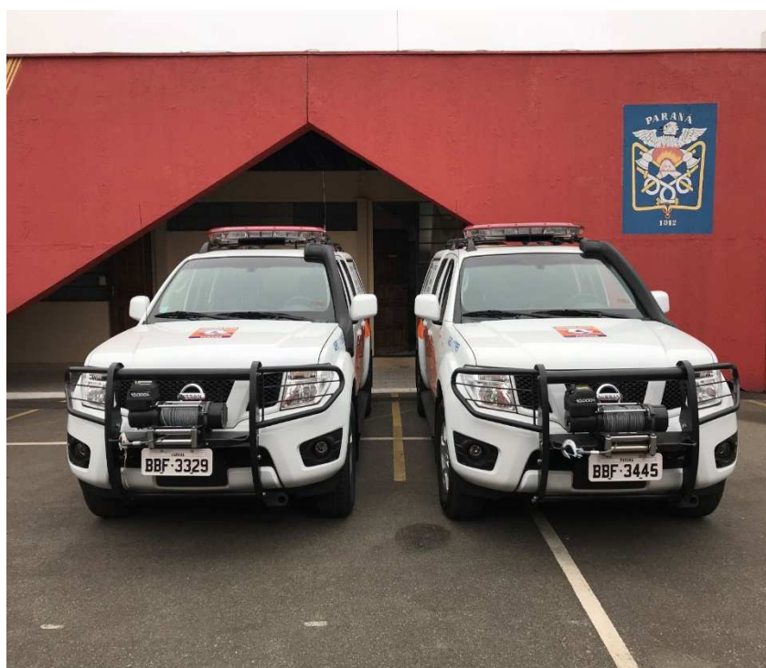
Figura 4 – Caminhonetes distribuídas ao 1º CORPEDEC