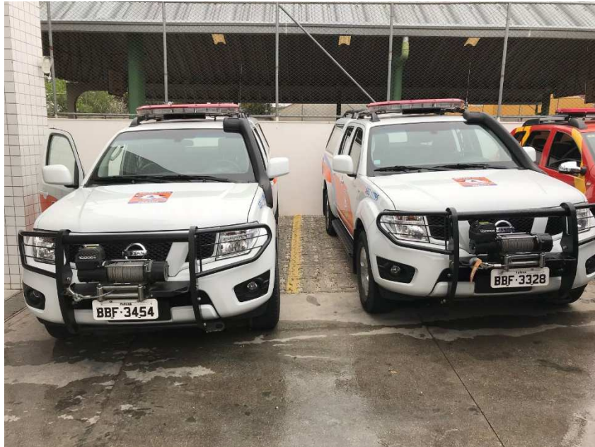
Figura 1 - Caminhonetes distribuídas ao GOST