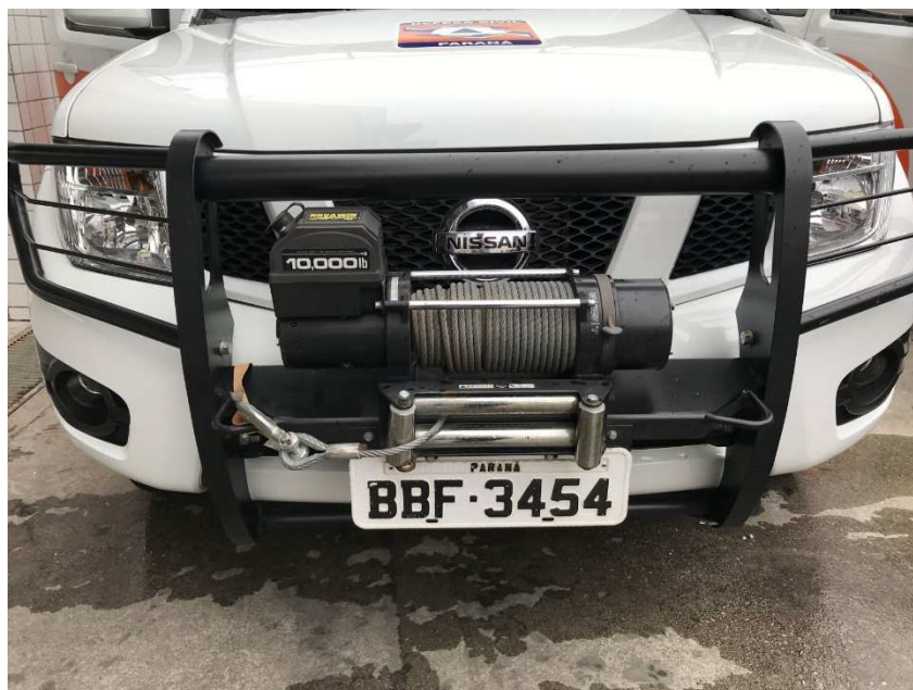
Figura 3 – Caminhonete distribuída ao GOST detalhe dos acessórios